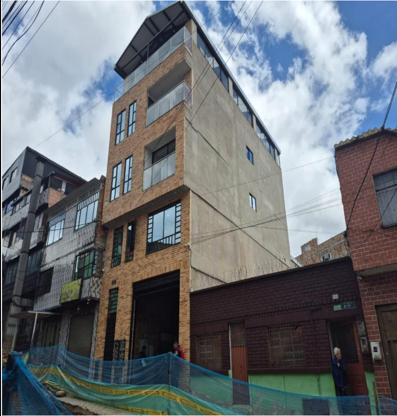
IMAGEN 3: FACHADA LATERAL