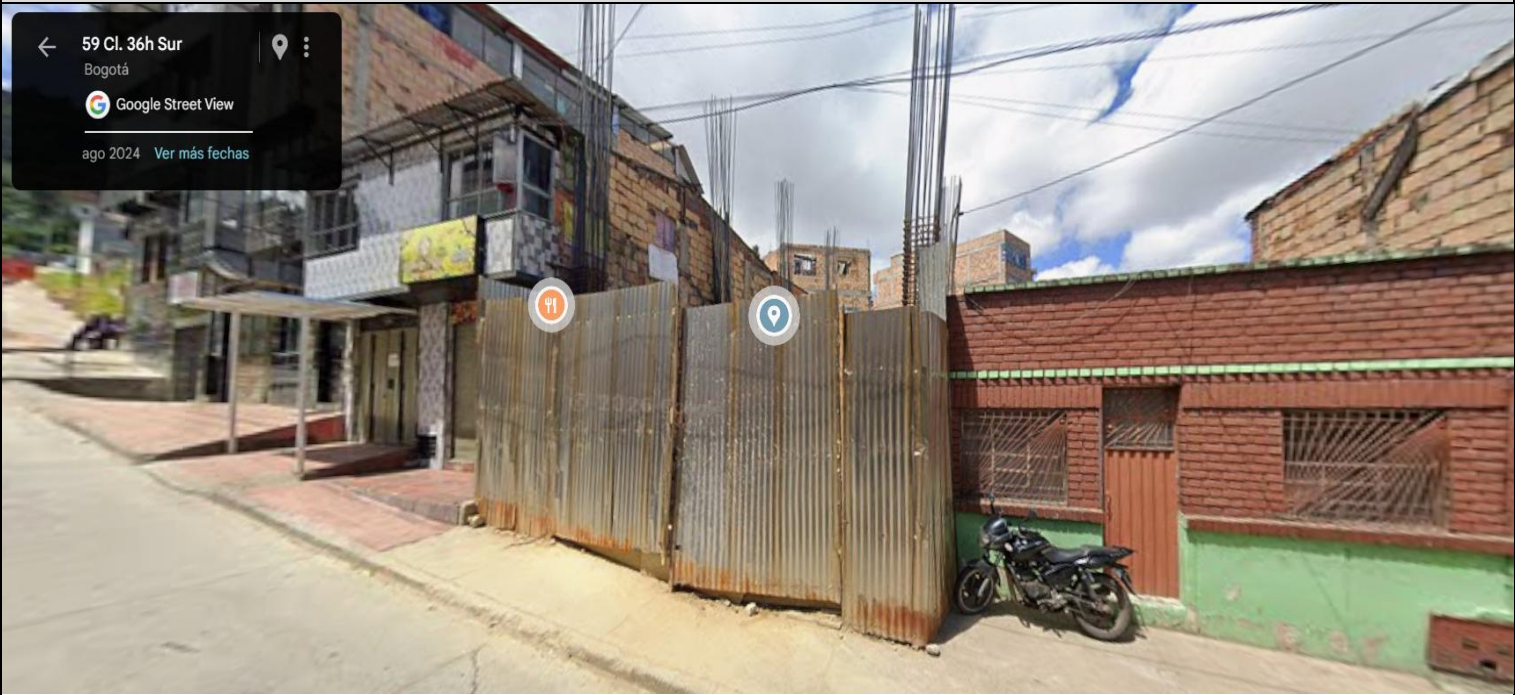
IMAGEN 1: NOMENCLATURA